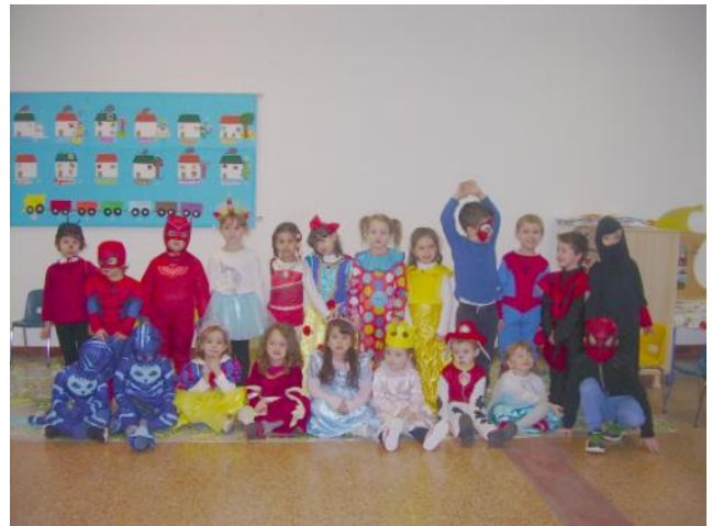
Tutti in maschera per Carnevale