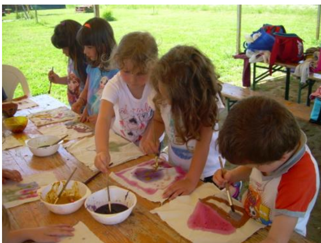
...e dipingiamo con i colori naturali