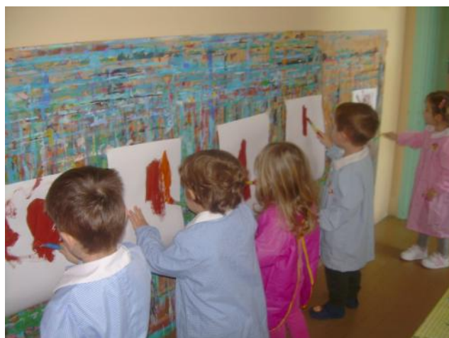
Come dei veri pittori