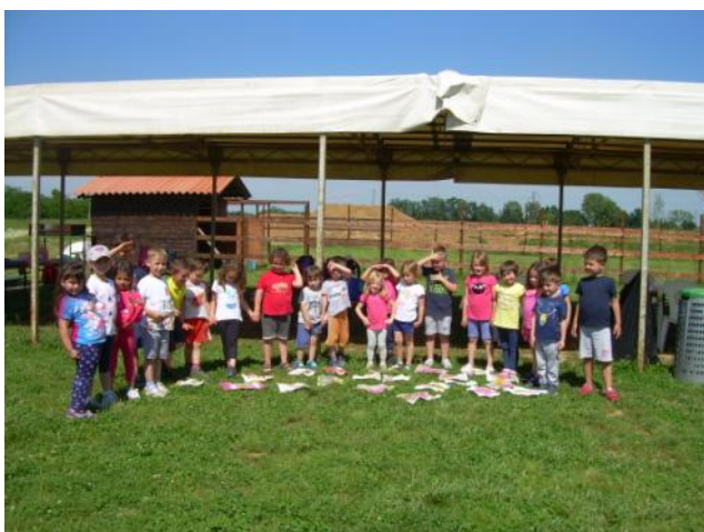
Una splendida giornata all'Astrobioparco di Felizzano...