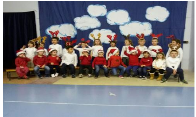
La nostra festa di Natale