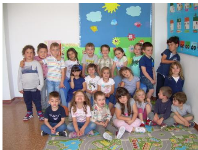
Alla fine dell'anno scolastico siamo tutti molto cresciuti!