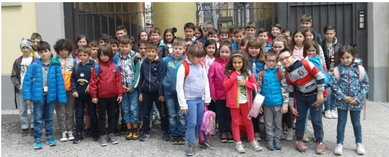
Visita all'"L'Officina della scrittura" di Settimo Torinese, antichissima Fabbrica Aurora, l'unica rimasta in Italia e famosissima in tutto il mondo per le sue penne stilografiche