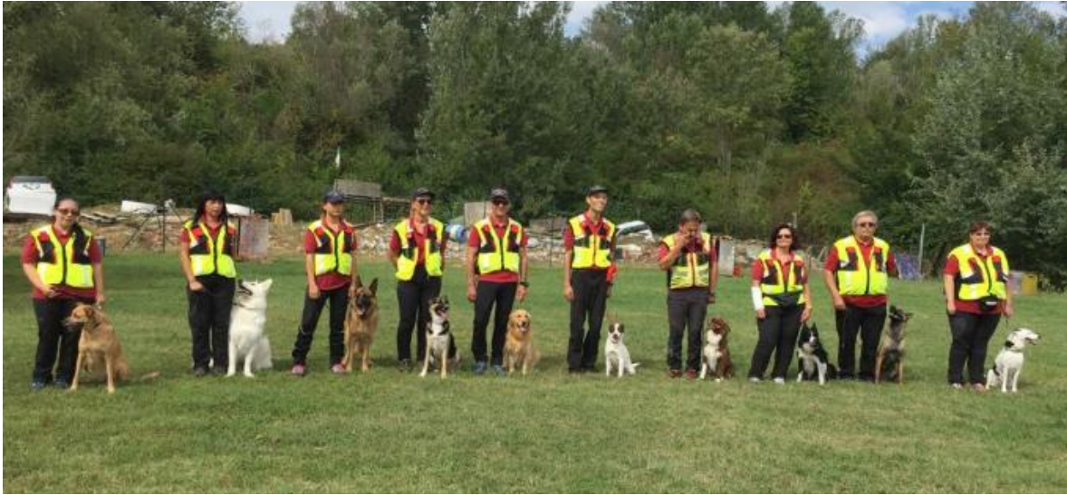
Le dieci unità cinofile da soccorso che attualmente fanno parte del Centro Cinofilo San Giorgio

A nche quest'anno il Centro Cinofilo di San Giorgio Monferrato si è confermato importante centro di formazione e valutazione delle unità cinofile da soccorso.