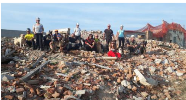
Esercitazione dei cinofili di San Giorgio al Campo macerie di Codogno

Il campo, terzo per grandezza e difficoltà in Lombardia, si distingue perchè allestito tra le rovine di una cascina al cui interno sono stati creati appositi nascondigli con tubi in cemento in grado di ospitare sotto terra una persona nascosta in condizioni di totale sicurezza.