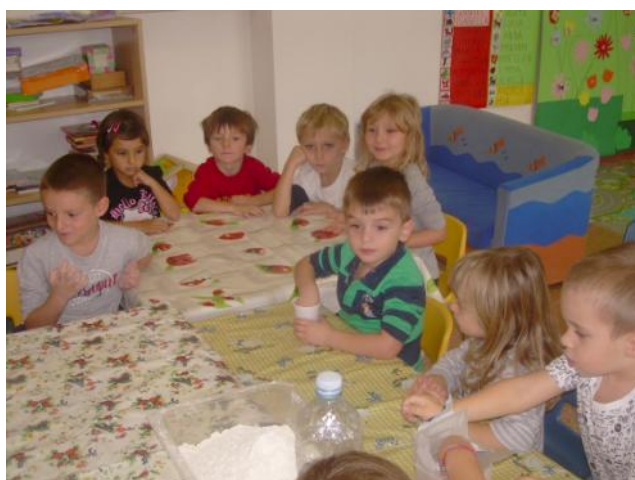
Creiamo con la pasta di sale