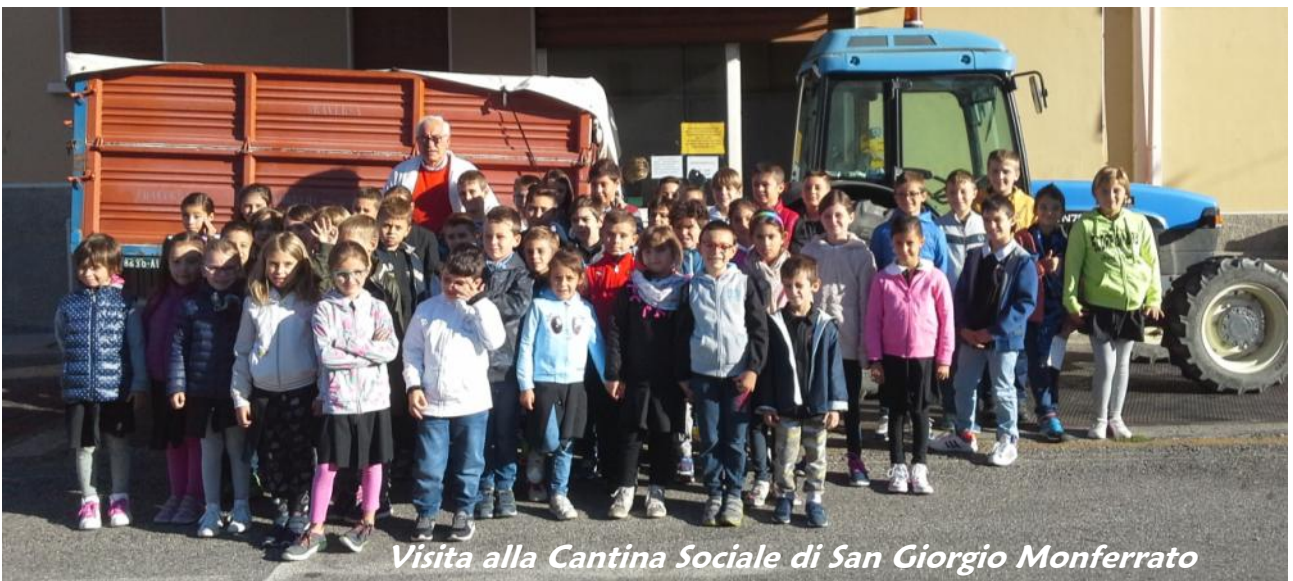
Visita alla Cantina Sociale di San Giorgio Monferrato