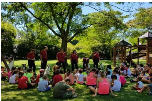
Un momento d'incontro delle unità cinofile con gli alunni delle scuole

Le unità cinofile di San Giorgio sono poi state invitate come di consueto ad alcuni momenti di incontro con gli alunni delle scuole, con lo scopo di favorire e sviluppare nell'infanzia la conoscenza e il rispetto del cane come compagno di vita.