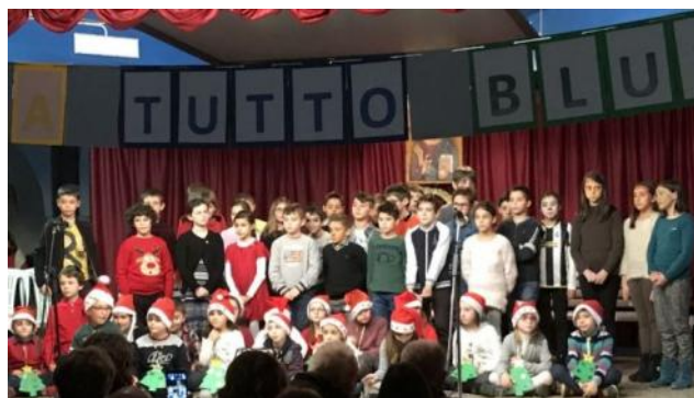
"Natale a tutto Blues"