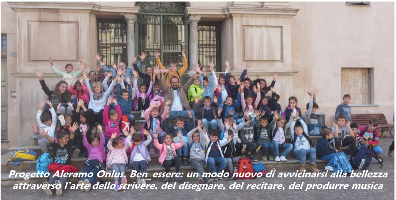
Progetto Aleramo Onlus. Ben_essere: un modo nuovo di avvicinarsi alla bellezza attraverso l'arte dello scrivere, del disegnare, del recitare, del produrre musica