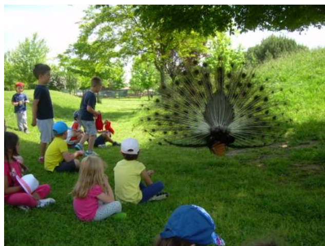
...dove scopriamo molti animali meravigliosi...