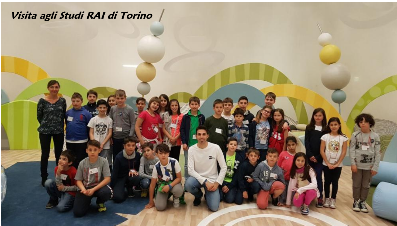
Visita agli Studi RAI di Torino