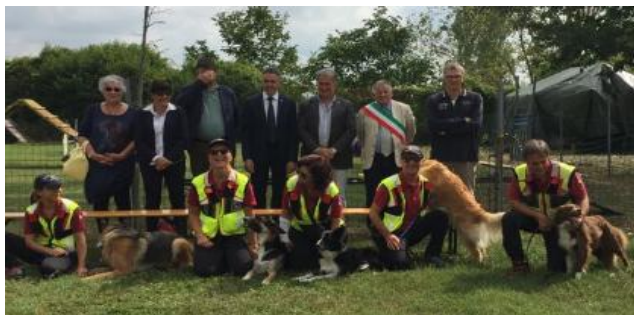
Un momento della festa "Quattro passi tra i nostri vini", con i cinofili e le autorità al campo

Il due settembre, in occasione dell'evento "Quattro passi tra i nostri vini" il campo di San Giorgio ha accolto il pubblico e le autorità comunali. Le unità cinofile si sono esibite esercizi di obbedienza, destrezza e ricerca dispersi sotto le macerie.