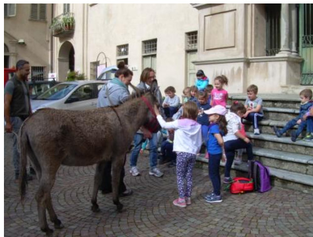
A Crea per una giornata con gli asinelli