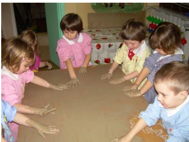
Attività di manipolazione con l'argilla