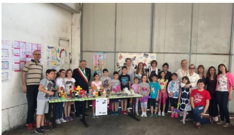
Anche quest'anno la nostra presenza alla Cantina Sociale di San Giorgio con lo stand allestito da genitori e bambini