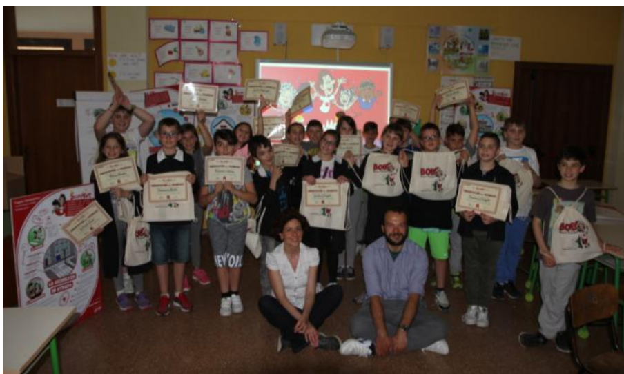
Lezione sulla sicurezza organizzata da Mip Consulting (società di consulenza per le aziende) in collaborazione con un'azienda "virtuosa" del territorio, la Bobst Italia S.p.A.