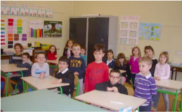
Il progetto di Continuità con la classe 1 ^ della scuola primaria