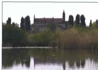
Piazza delle Erbe a Mantova. Il Santuario della Beata Vergine a Grazie di Curtatone visto dal battello.