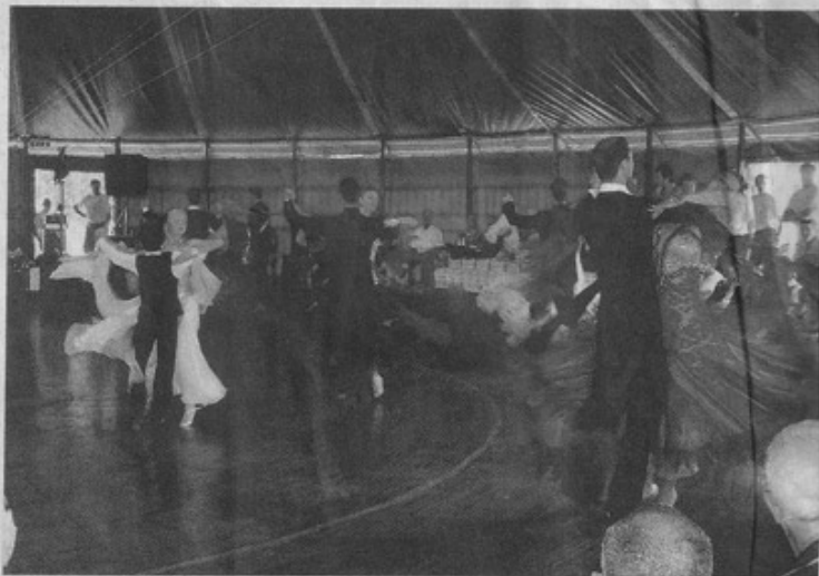
Ballerini nel 2011 a Villamiroglio, alla Festa dei Pois organizzata per la rassegna Riso&R