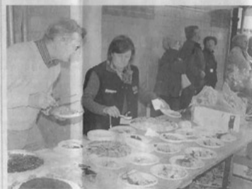
Un momento del concorso delle torte ad Alfiano Natta