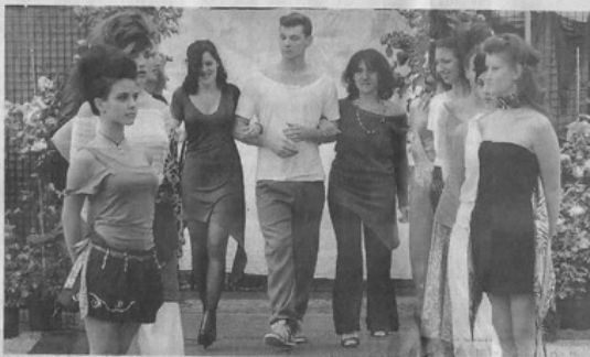
Un momento della sfilata di moda che si è svolta nell'ambito di Coniolo Fiori

Pontestura Ricostruita l'antica Fiera di S. Michele