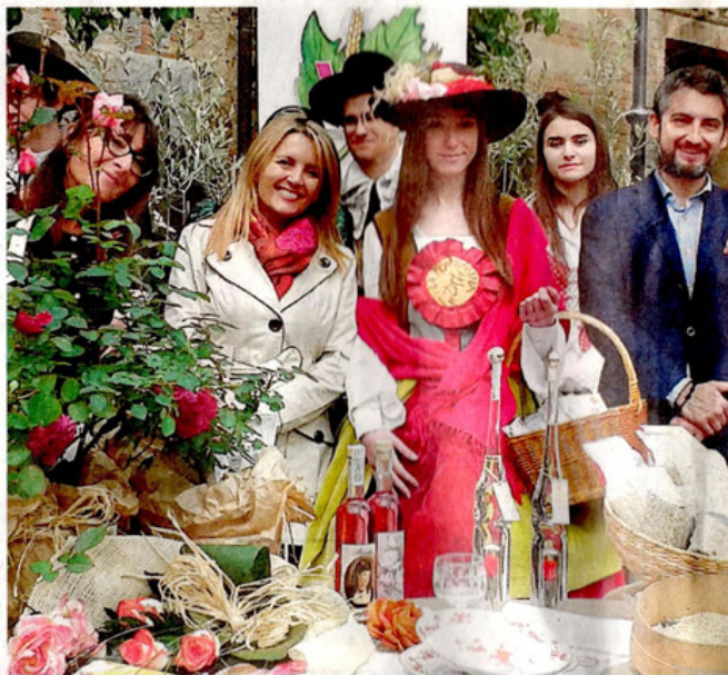
servizi alle pagine 23 e 25

►► Primo weekend di Riso & Rose, kermesse promossa da Mondo. Gli appuntamenti si svolgeranno a Casale (degustazioni di riso, mostre di Camillo Francia e arazzi al castello, mercatini Rose e Fiori , Doc Monferrato e antiquariato), Vignale (spettacolo, mostra e Mercatino di maggio ), Gabiano (la kermesse Vino a Corte ), Ponzano (con mostre e visite de Il giardino diffuso ), Moncalvo (esibizione e sfilata di costumi medievali), Pobietto (apre il rinnovato centro visite del Parco del Po con la mostra sui pipistrelli), Alfiano Natta (mercato di prodotti tipici per il Giardino d'Europa), Fontanetto (che propone la Mangialonga ), Moletto (visite guidate al borgo), Grana (con Riso, Rose e Ruchè ). Com'è ormai consuetudine, in occasione di questa kermesse il nostro giornale porta all'occhiello una rosa. Su questo numero ecco la rosa Monferrato : ha il nome del nostro territorio e fiorisce in questi giorni in tutti i giardini. Creata dal grande ibridatore inglese David Austin, ha il colore dei nostri vini, è profumata, fiorirà fino all'autunno. Intanto la puntata di Linea Verde in programma domenica mattina, sarà dedicata al Monferrato con una ricca panoramica sulle località e sui prodotti enogastronomici ripresi dalle troupe di Rai Uno nello scorso mese di aprile in particolare a Camagna e a Vignale.