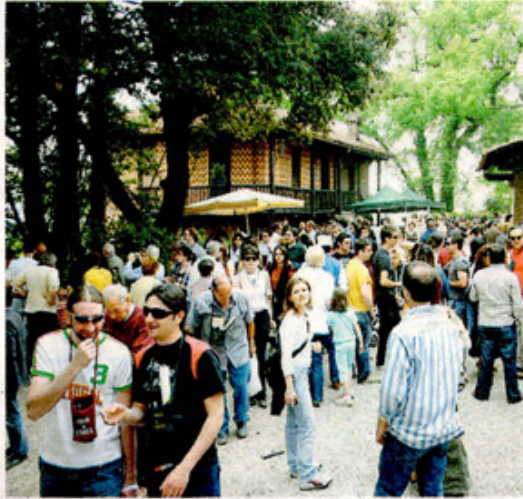
Folta partecipazione all'evento 'Vino a Corte' del 2011