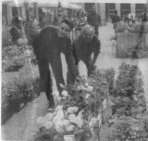
Alcuni espositori florovivaisti domenica in piazza Mazzini