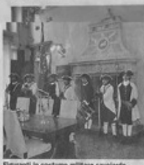
Figuranti in costume militare savoiardo