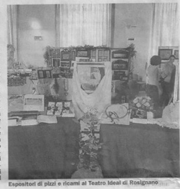
Espositori di pizzi e ricami al Teatro Ideal di Rosignano