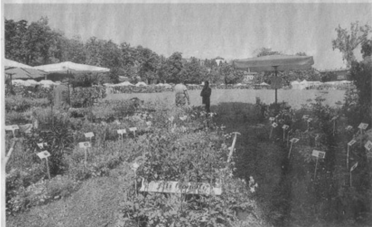
160 espositori nel prato circolare di Masino. Sotto: la rosa "Eyes for you"

L'anno scorso aveva ottenuto il primo premio in occasione di "Riso e Rose"