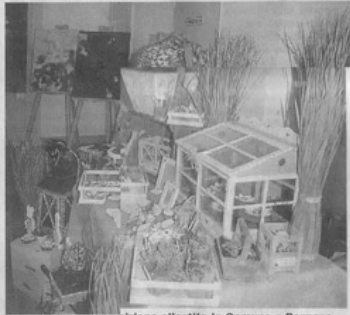
Particolare di un'esposizione allestita in Comune a Ponzano