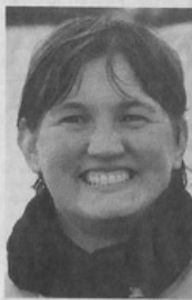
Il premio "L'atuola più bella"