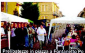
Prelibatezze in piazza a Fontanetto Po