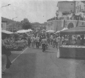
Bancarelle domenica in piazza Vittorio Veneto