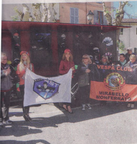
Gruppo di Vespe nel 2011 a Mirabello per Riso&Rose