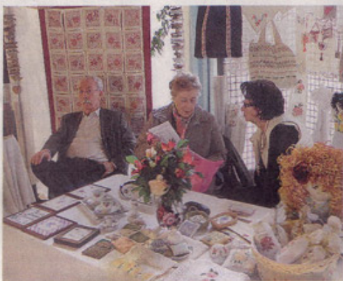
Ricamatrici all'opera all'Ideal di Rosignano per Riso & Rose