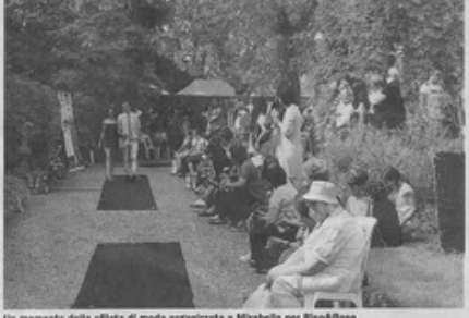
Un momento della sfilata di moda organizzata a Mirabello per Riso&Rose