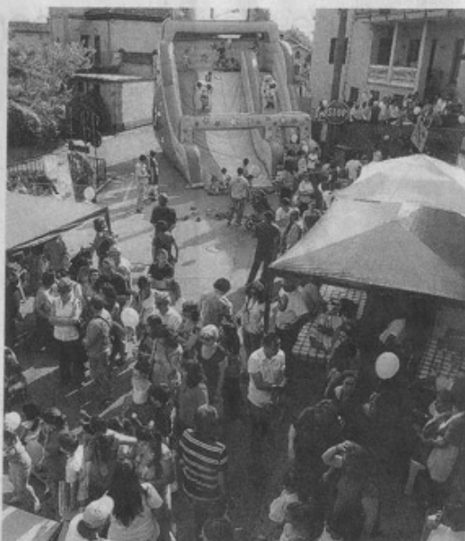
Mombello e Riso&Rose: un'immagine dell'edizione del 2011