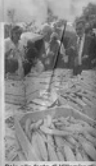
Pois alla festa di Villamiroglio