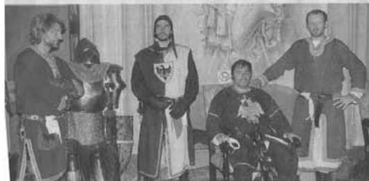
Rievocazione storica al castello di Giarole in occasione della rassegna di Riso&Rose