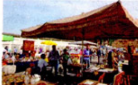
Mercatino dell'antiquariato e bancarelle di Buongiorno Italia a Casale

A Fontanetto Po si è svolta la "Mangialonga" prevista anche se in misura un po' più ridotta. Grana ha tenuto duro, ha seguito il programma dell'evento ed ha ottenuto buona affluenza di pubblico, cui si è aggiunto un tour proveniente da Casale , realizzato per Riso & Rose, che ha fat-