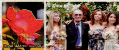
Rosa "Marco Musso" pomeriggio, malgrado la pioggia, l'effe scoop, moda e spettacolo di Torino, ha proposto una sfilata di abiti di alcuni giovani stilisti torinesi.

promozionale delle bellezze artistiche, storiche e culturali della provincia toscana. Tema dell'edizione appena andata in archivio è stata la bellezza in mezzo alle bellissime rose, sabato pomeriggio tre fotomodelle (in foto con il Sindaco) sono state protagoniste di un set fotografico, mentre domenica