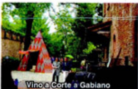
Vino a Corte a Gabiano