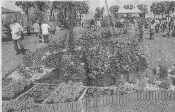
Uno scorcio di Coniolo-Fiori lo scorso anno

Domenica 13, a Ponzano dalle 10 si potrà ammirare l'esposizione "La Rosa dei Pittori". Presenti anche stand di fiori e prodotti tipici. Alle 10,30, nell'ambito dell'iniziativa "Il giardino diffuso", in collaborazione con l'Ecomuseo della Pietra da Cantoni, saranno aperti al pubblico parchi e storiche dimore, tra cui Villa Larbel di Salabue. Sin dalla nascita della manifestazione, ormai imperdibile