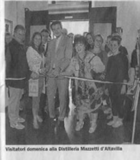
Visitatori domenica alla Distilleria Mazzetti d'Altaffa