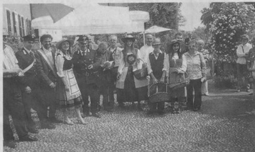
L'inaugurazione con le autorità a Ozzano Monferrato della manifestazione di Riso&Rose

Ozzano: tipicità agroalimentari, mostra sulle cave, rose