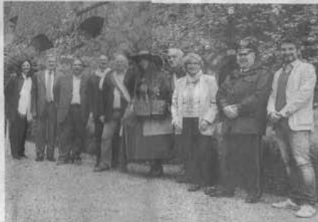
Autorità con la 'Monferrina' al castello di Camino per la kermesse Riso&Rose

La festa caminese, concentrata nel parco e nel Castello dei Marchesi Scarampi, anche se non sono mancate le visite negli antichi saloni del maniero, rese ancora più particolari dall'esibizione di alcuni bravi ballerini di tango. Il castello di Camino attrae da sempre turisti e gli appassionati di storia medievale.