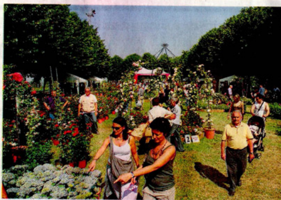
'Coniolo-Fiori': immagine di repertorio della passata edizione della mostra florovivaistica