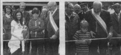
Inaugurazione di Vivere in Campagna e taglio del nastro per la fine dei lavori di ristrutturazione dei locali di Villa Poggio

TERRUGGIA (a.m.) - Nonostante i timori per il maltempo e la decisione, nelle ultime ore, di spostare le bancarelle dei tanti espositori all'interno del nuovo Palatenda, questa nuova versione del "Vivere in Campagna", giunta alla diciannovesima edizione e anticipata di un mese rispetto alla data tradizionale del primo fine settimana di giugno, è stata un nuovo successo.