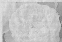
Dall'alto in basso le rose vincitrici di Coniolo Fiori: Queen of Denmark , Domenica , William and Catherine

sinonimo Königin von Dänemark , è una Rosa alba del