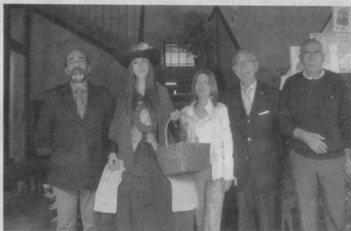
La Monferrina; simbolo di Riso&Rose, è accolta alla Pila del castello