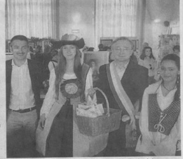
Il taglio del nastro di 'Ancora Fili, Ricami e Fantasie'