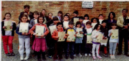
I bambini con il sindaco e il presidente dei Lions

MOMBELLO - Nell'ambito di "Riso e Rose" la Pro-Loce e l'Amministrazione comunale organizzano una serie di incontri presso il Belvedere Melvin Jones (Chiesetta di S. Martino).