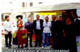
Assessori e organizzatori