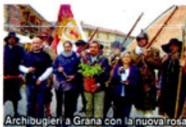
Archibuglieri a Grana con la nuova rosa