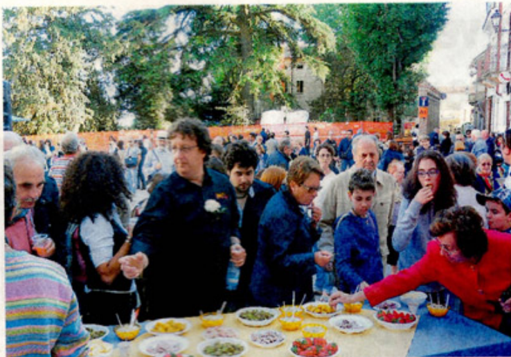
Visitatori lo scorso anno a Vignale agli appuntamenti allestiti in occasione di Riso & Rose