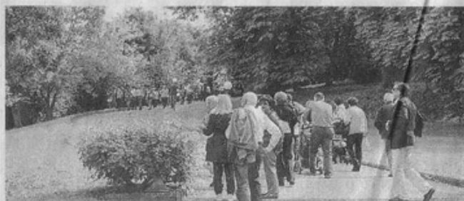
Pubblico in visita alla Mandoletta

Ancora un successo per l'iniziativa il "Giardino diffuso", promossa dall'Ecomuseo della Pietra da Cantoni, che domenica 6 maggio ha aperto il parco della villa La Mandoletta ai visitatori.