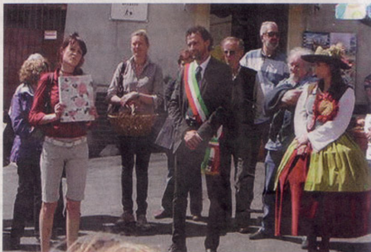
Riso & Rose edizione 2011: manifestazione in piazzetta San Giovanni a Ozzano Monferrato

Weekend Presenti esperte italiane ed internazionali, vini, gastronomia