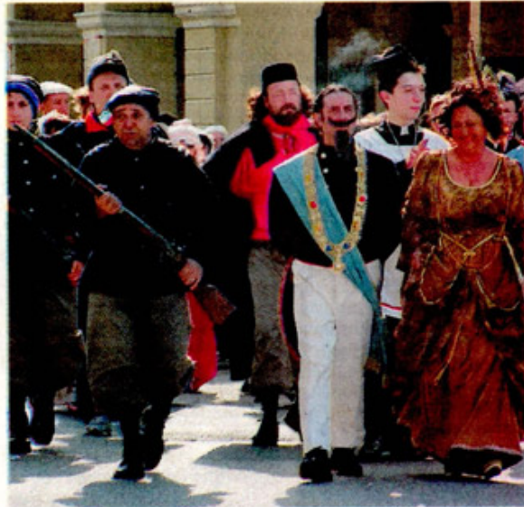
La rievocazione con figuranti a Pontestura dell'Unità d'Italia